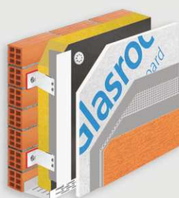
3 Σύστημα Εξωτερικής Τοιχοποιίας με αεριζόμενη πρόσοψη