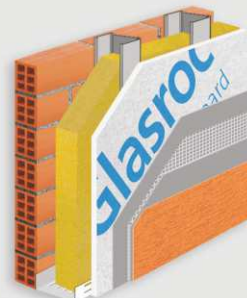
4 Σύστημα Εξωτερικής Τοιχοποιίας (2), άμεσης επίχρισής