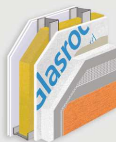
2 Σύστημα Εξωτερικής Τοιχοποιίας με ETICS