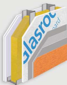
1 Σύστημα Εξωτερικής Τοιχοποιίας (1), άμεσης επίχρισής